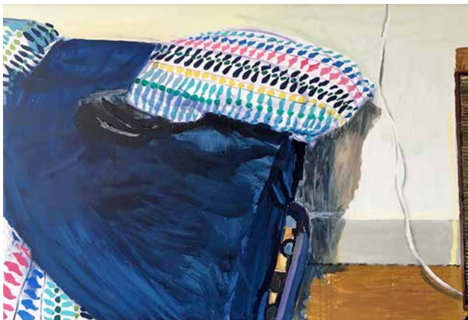
Mi casa - teléfono, acrílico sobre lienzo, 80 x 100 cm, 2018