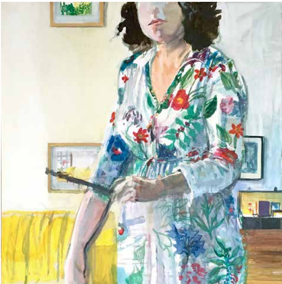
Retrato de vestido de flores, óleo sobre tela, 100 x 100 cm, 2019