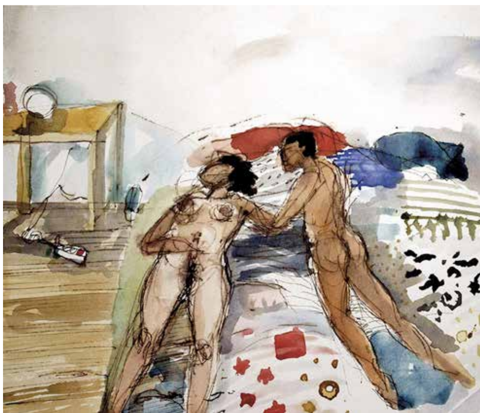
Alfama, de la serie Desde mi cama, Lisboa, 2010/12

Lo que se revela en esta exposición, y en extensión en su obra, es la franqueza en el modo de articular el lenguaje pictórico, la transparencia y reconocimiento de esos combates, saltos, vacíos, derivas. La pintura descubre la visceralidad y carnalidad del aire que