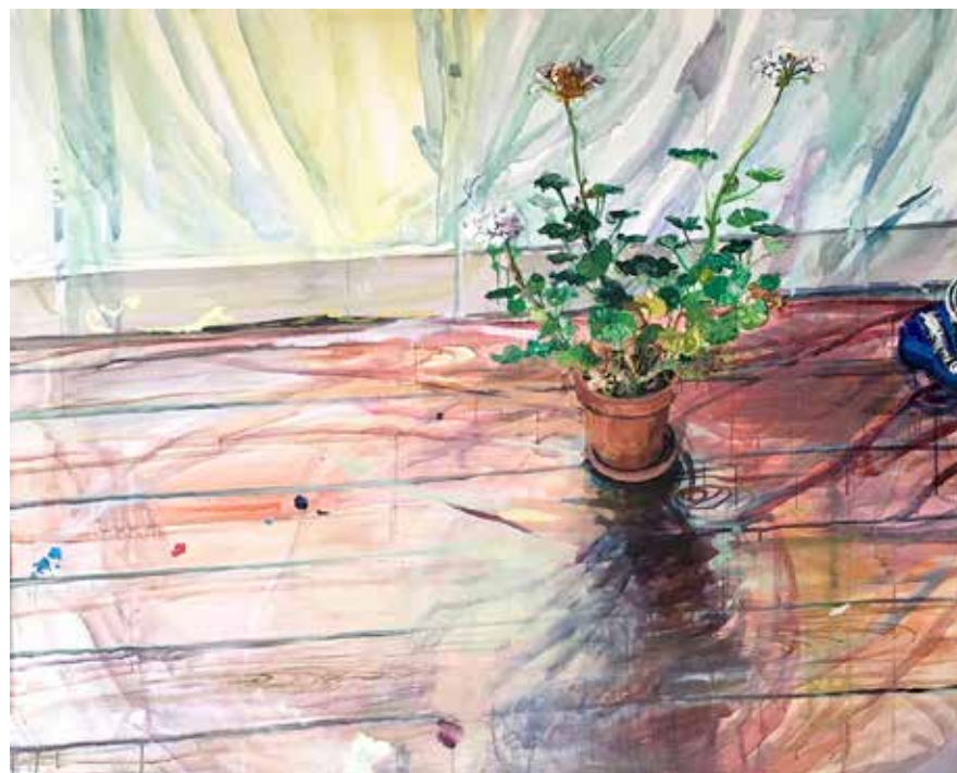
El suelo del taller, mixta sobre tela, 2020

Todo lo que conforma el espacio de su Casa-Taller, es para la artista un motivo digno de ser retratado y expuesto, como ella misma expresa, aludiendo a la discriminación existente a lo largo de la historia respecto a géneros artísticos como la naturaleza muerta, el paisaje o las escenas de género, considerados menores y apropiados para ser tratados por las artistas, debido a sus cualidades "innatas", "la pintura de plantas y flores acarrea una fuerte connotación de pintura de género menor. Contra grandes prejuicios, plantas sexys, please"