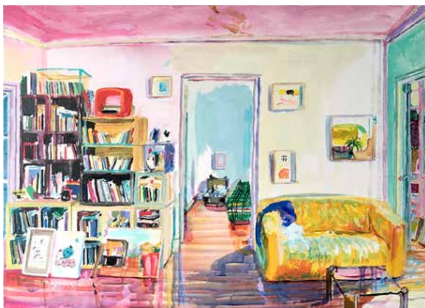
Sigue habiendo un ornitorrinco azul en el sofá, acrílico sobre lienzo, 65 x 92 cm, 2020

Al contemplar las obras de la artista, entramos de lleno en la relación entre pintura y temperamento. El color hace historia, es su espectro, su pregnancia. No podemos obviar la concepción de la creación, especialmente del acto pictórico, como manifestación de una subjetividad despierta y latente, manifiesta e irreverente.