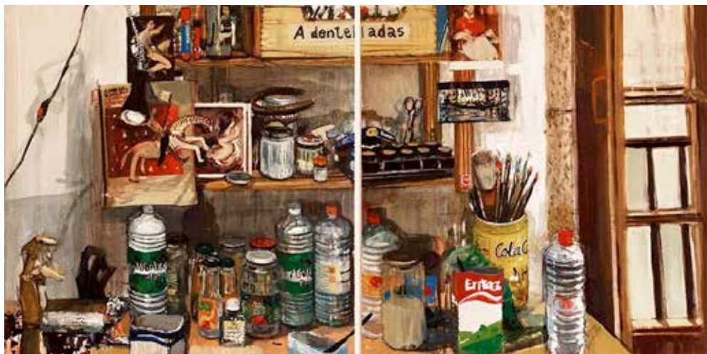
A dentelladas, mixta sobre tela, 2006/07

En la representación de los espacios de intimidad de la artista, las personas no rondan las ventanas, no están de espaldas, ni miran por la ventana, marcando un juego de distancias entre interior y exterior, abismándonos al ensimismamiento o al acto de contemplación. La vida no sólo se contempla, se agita, se explora, se vive. La habitación propia es una aventura.