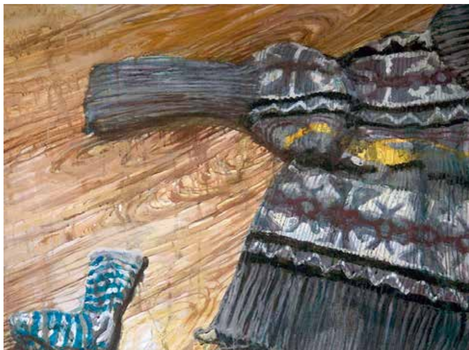
El jersey en el suelo, mixta sobre tela, 2012

La frescura y el carácter dinámico que ejercitan los trazos de todos estos retratos, dicen lo que piensan, como puede leerse en el neón situado en una de las salas de la exposición: " Mis amigos me ponen cachonda ".