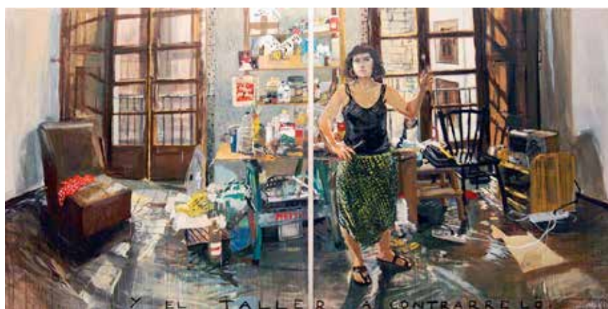
El taller a Contrarreló, técnica mixta sobre tela, 2007. Premio Adquisición en el XI Certamen de Bellas Artes Isaac Díaz Pardo, Diputación Provincial de A Coruña, Septiembre 2009

Una atención y estudio de lo presente que desdibuja los límites entre lo íntimo y lo colectivo, lo personal y lo político, conjugando visiones y emergencias que nos conectan con pilares tan importantes de la vindicación feminista como los que sustentan “Una habitación propia” de Virginia Woolf.