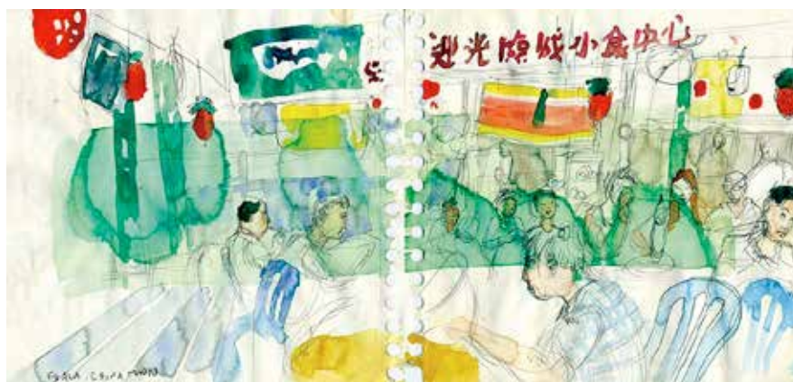
Dibujo perteneciente al cuaderno de viaje "de kuala lumpur a beijing", 2016.